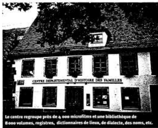
Le centre regroupe près de 4 000 microfilms et une bibliothèque de 8000 volumes, registres, dictionnaires de lieux, de dialecte, des noms, etc.

Contact: Centre départemental d'histoire des familles, place Saint Léger, 68500 Guebwiller, tél.: 03.89.76.91.75.